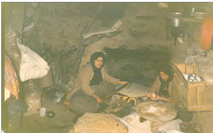
دایکی هاوړې و خوشکه زهینه ب خیزانی هاوړې گوزان له کاتی نانکردن - نالوه تان - ۱۹۸۸/۱/۲۳