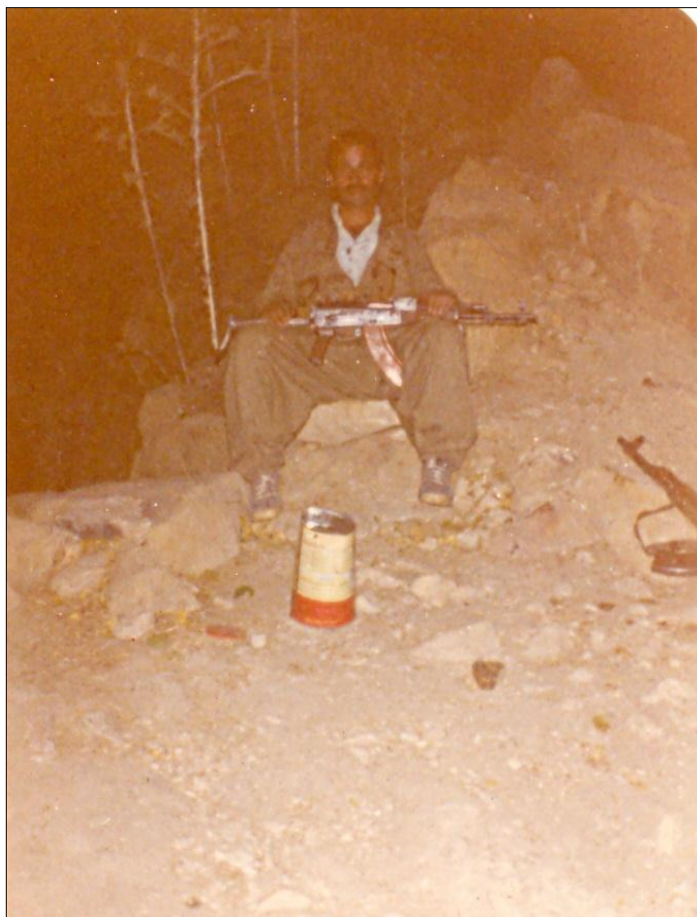
نوسه‌ر - له‌کانی زودان له‌کاتی مه‌فره‌زه ١٩٨٧