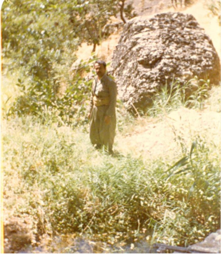
نوسەر - له کاتی ئه رکی پيشمه رگايه تی له چيایی (بيديۆ) ۱۹۸۶