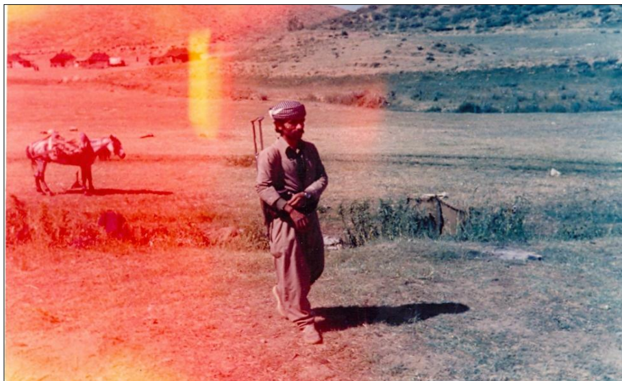
هاورپڻ عهلی سهده - کویستانی قه ندیل - ۱۹۸۳