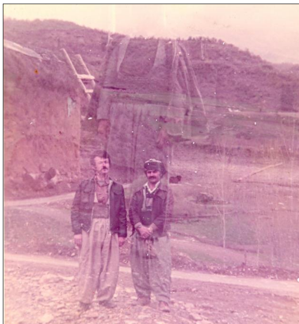
نوسہر، ہاوری ہہ مزہ سور