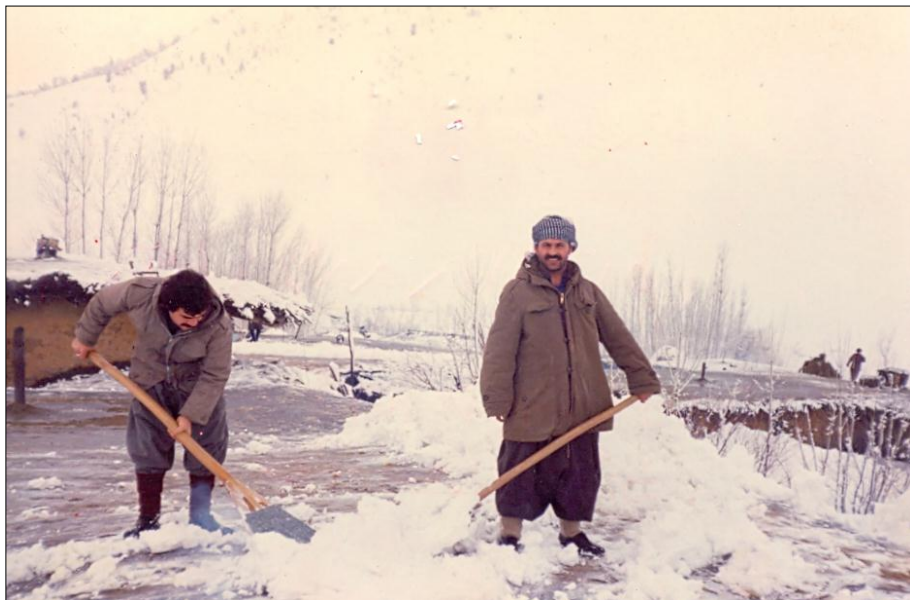
له راسته وه: نوسه ر، هاوړې ریا، کاتی بهر مالتین - نالوه تان - ۱۹۸۸/۱/۲۹