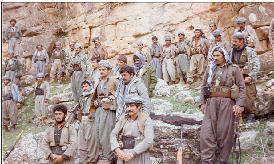
شهید عهلی حاجی و هیژیک له هاورپيانی پشمه رگه