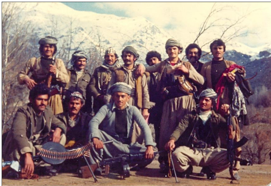
نوسەر، له گهڼ هاورپيانی لقی پشدر - پش تاشان - تشرینی دووهم سالی ۱۹۸۱