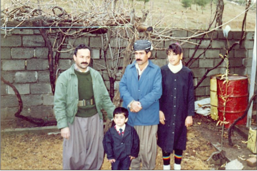
نوسهر، هاوری سورہ، کویتستانی خانی کچی هاوری سورہ ، راستی برای. دوی راپه رین سلیمانی