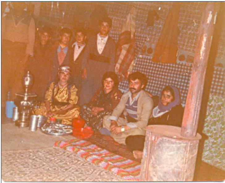
نووسهرو دایک و خوشک و برایه کانی ۱۹۸۲