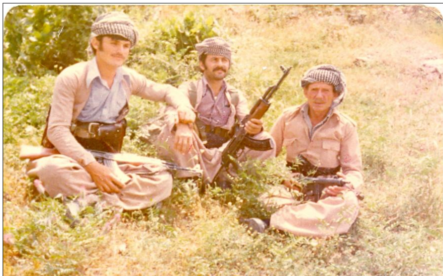
ناوہراست: نووسہر، شہہید مام رہسول، شہہید محمدہ رہسول