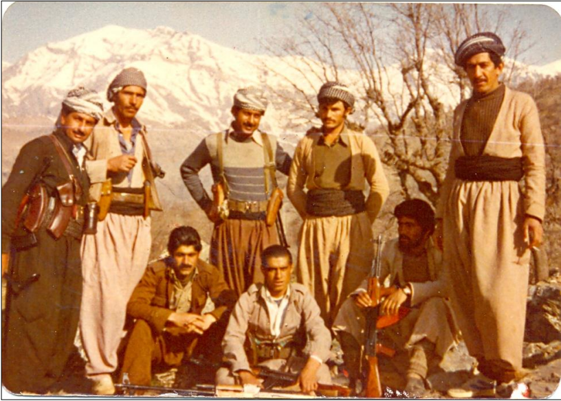
شهید هیوا و هاوړیانی - پشتناشان ۱۹۸۳/۴/۴