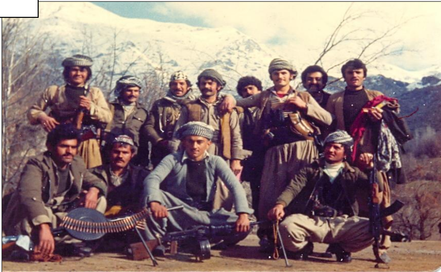
نوسەر لەگەن ھاورپىيان - پشتتاشان ۱۹۸۱