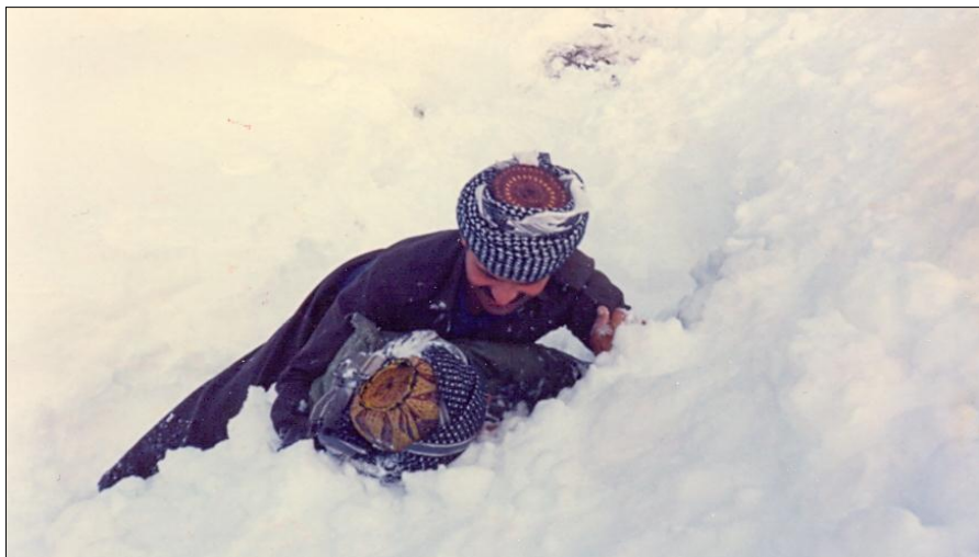
نوسہر لہ کاتی شہرہ بہ فر لہ گہن ہاوری عہلی گوران — نالوہ تان — ۱۹۸۸/۱/۳۰