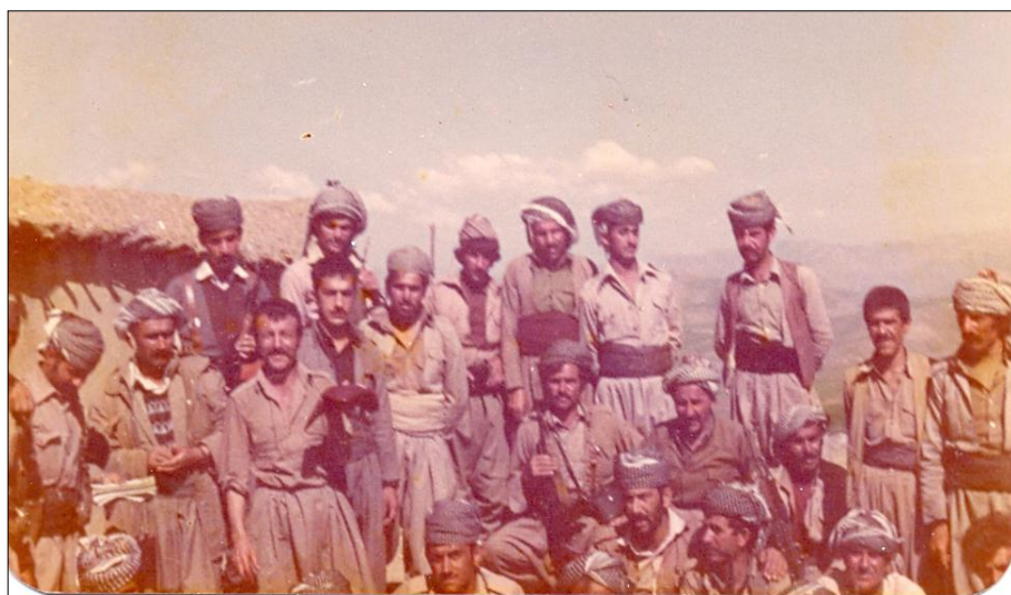
نوسەر له گهڻ هاوڕێییانی لقی پشدهر کوردستانی رۆژههلات گوندی (مهشکان) ۱۹۸۳