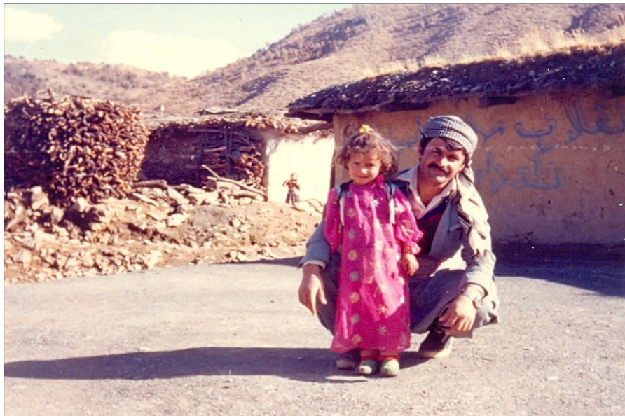
نوسهر و هونیبای کچی - نالوه‌تان - تشرینی یه‌که‌م ۱۹۸۷