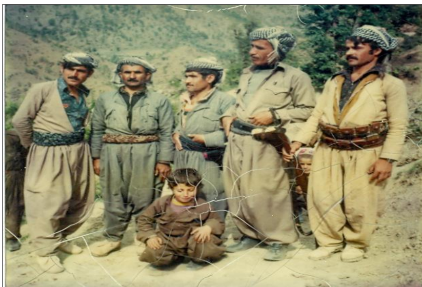
له راسته وه: نوسهر، وهستا ره سول. سوره، خدر وهستا ره سول، فهقی عه بدوللا. نه حمه دی کاکي به کر