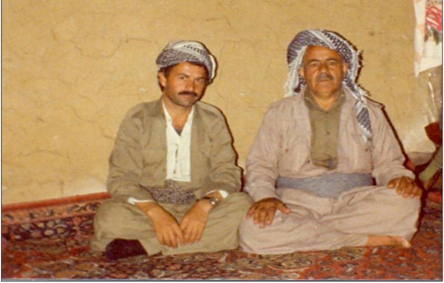
نوسہر، مام وہلی - ٹالوہ تان - ۱۹۸۶/۸/۱۷