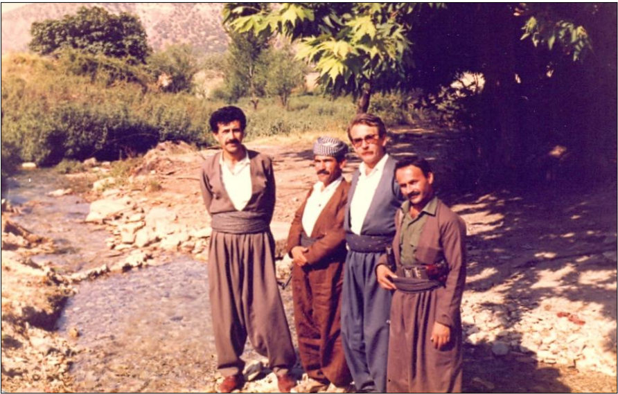
نوسهر. هاوری کاروان شاکره بیی ، سورہ، شہمال حہویزی کانی گہرژتہ لہ بناری سفین -