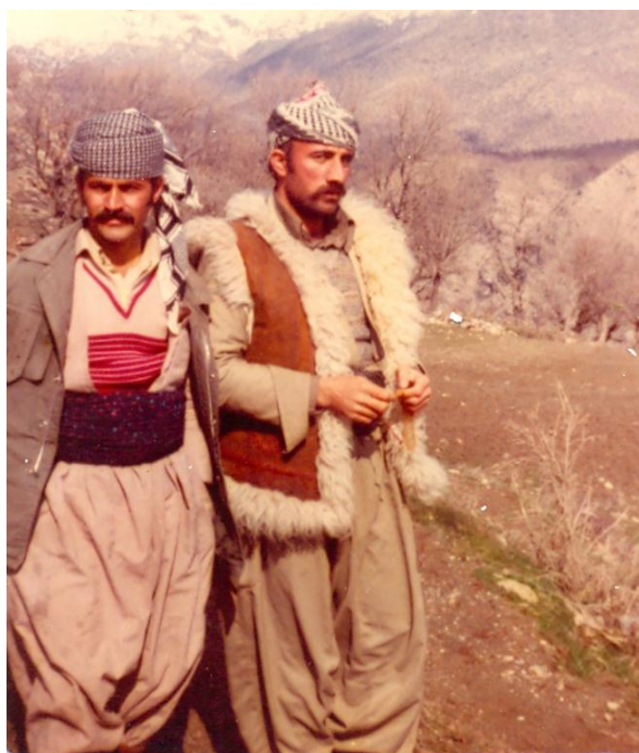
نوسهر- هاورپڻ حه سهن خدر