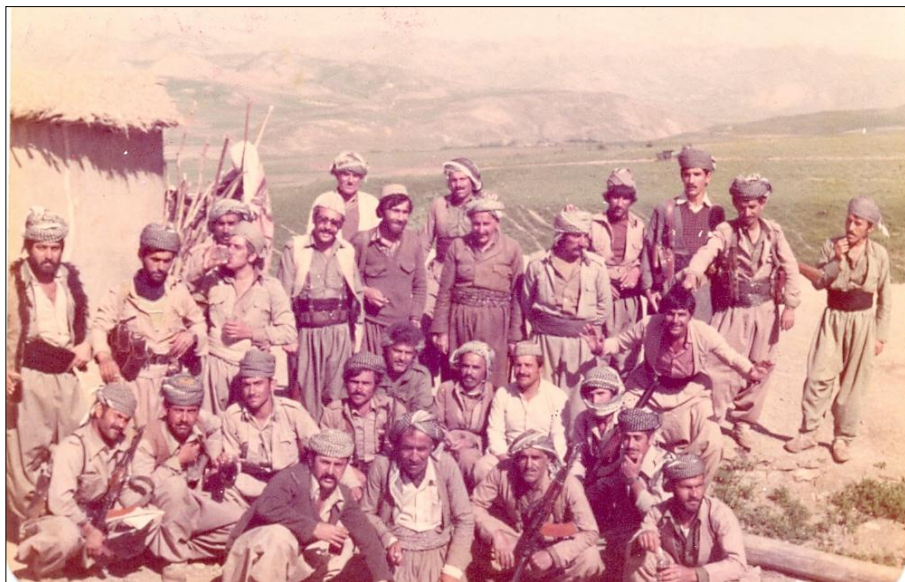
نوسه هاورییانی لقی پشدهر - روژه لاتی کوردستان گوندی مهشکان - ۱۹۸۳/۶/۵