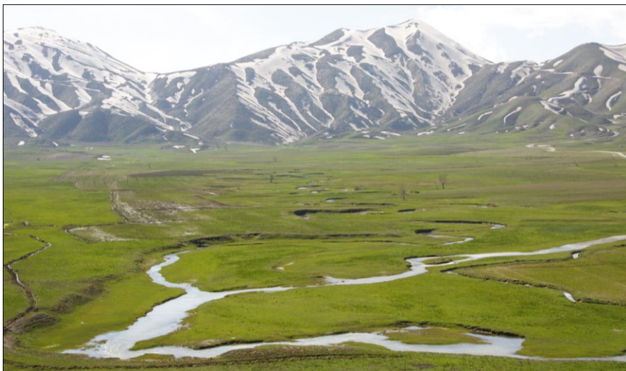
دەشتى ۋەزنى - كوردستانى رۆژھەلات