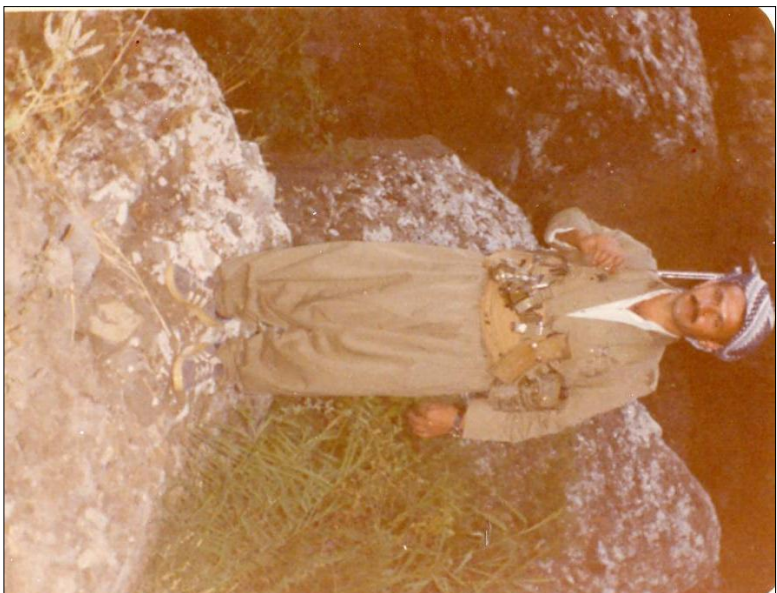
نورسمر — گوتیزلی — تہ ہوموزی ۱۹۸۶