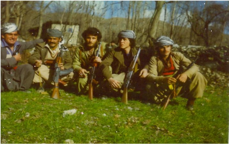
لہ چہ پوہ دووہم نووسہر، شہید رسول، ہاور بیانی سلیمانی - گوندی بیتوش ۱۹۸۱