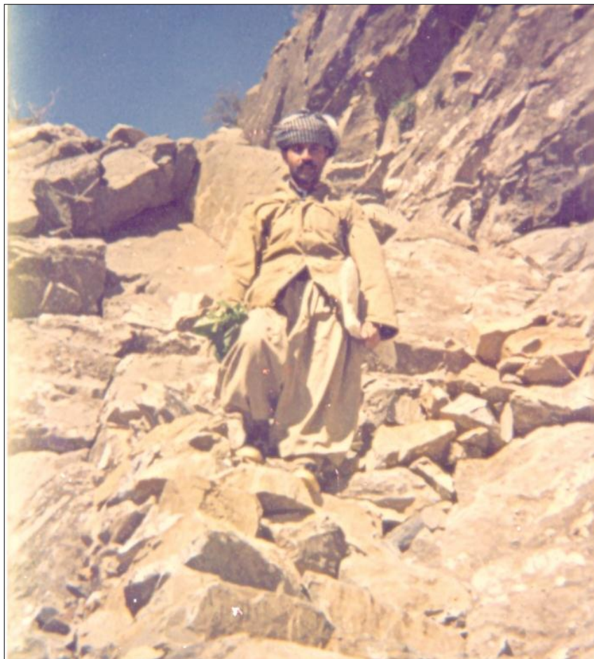
نوسەر ریڭای دۆله کۆڭه — سوئیسنى ۱۹۸۶