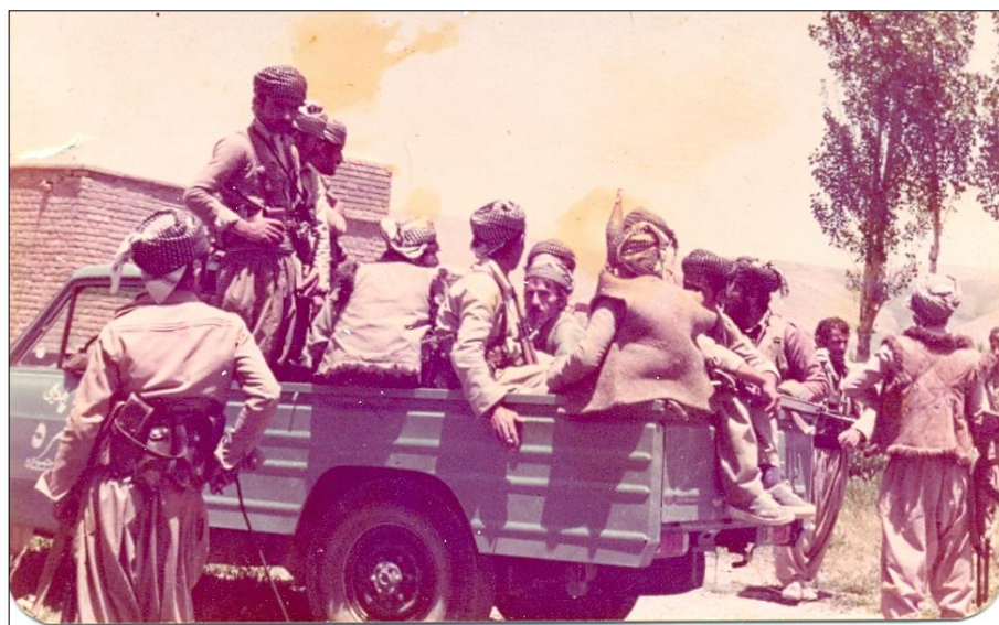
هاورییانی لقی پشدهر له کاتی رویشتنا - ئالوه تان -