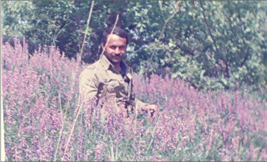
نوسەر - سهرچيای بيدو - ۱۹۸۷/۵/۲۵